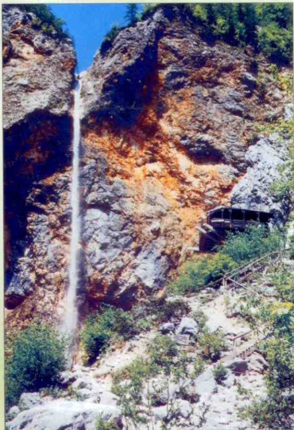
Slap Rinka z Orlovim gnezdom