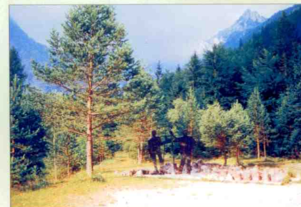
Spomenik pred Domom planincev